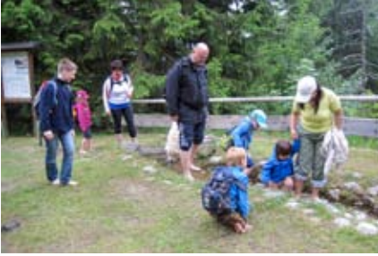
Endlich Füße abkühlen