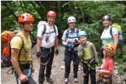
Einstieg am Colodri

A M ABEND, nach dem Großeinkauf, wurde dann immer zusammen gekocht. Der Einkauf für die doch