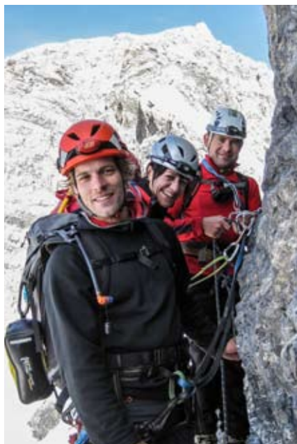
Vor der Schlüssenstelle

brachten wir zügig hinter uns und standen um 12:38 Uhr bei herrlichem Sonnenschein auf dem Gipfel des Ortlers, dem mit 3905 Meter größten Berg Tirols. 3905 Meter nach italienischer Vermessung, für die Österreicher ist er nämlich nur 3899 Meter hoch, die