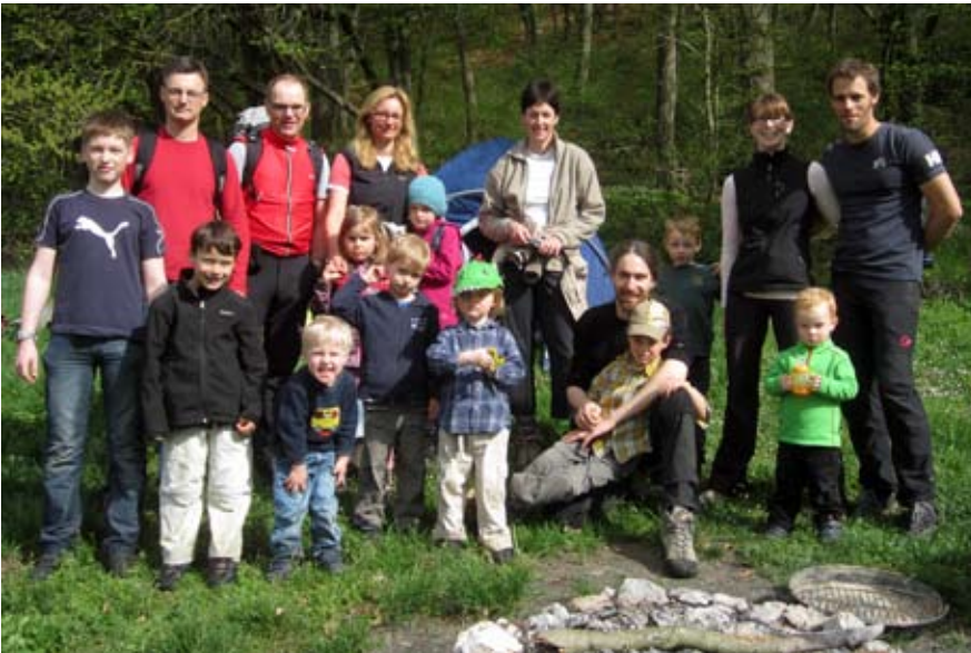
Nicht alle, aber einige der Bogenbauer

D IESE STÄRKUNG war auch nötig, denn ein Teil der Gruppe legte bereits Spuren für eine Schnitzeljagd. Trotz ihres großen Vorsprungs konnten die Verfolger diese einholen und an der alten Burg am Felsengarten stellen. Zurück ging der Weg über den Oberländer Steig. Beendet wurde das Lager mit einem gemeinsamen Essen im Naturfreundehaus bei Konstein. Die Berglöwen