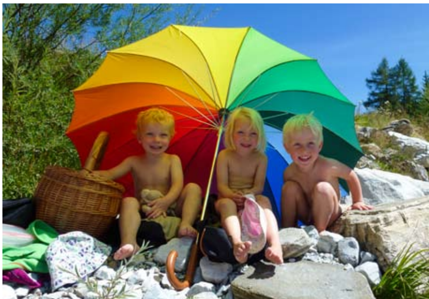
Anstatt zu klettern, faulenzten wir im Bachbett