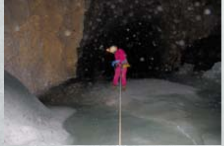
Abseilen in die Tiefe