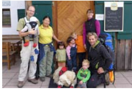
Vor der Gufferrhütte

D AS WAR auch die richtige Entscheidung, denn nach gesamt neun Stunden erreichten wir unser Ziel pünktlich um 19:00 Uhr zum Abendessen. Für unsere Strapazen wurden wir mit einem Viergänge-Menü mit Speckknödel und Keiserschmarrn belohnt. Auf der Hütte, die eigentlich immer sehr gut besucht ist, waren wir die einzigen Gäste, das haben wir wohl dem vielen Regen zu verdanken. Einzig ein Texaner auf seiner Weitwanderung durch die Alpen hatte sich noch zu uns gesellt. Den Kindern hatte die Wanderung wohl noch nicht gereicht, sie tobten noch eine ganze Weile durch die Hütte, nur die Eltern und der Hund hatten genug für heute.