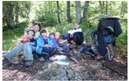
Die erste Rast

unsere ganze Aufmerksamkeit. Stellenweise seilversichert ging es ausgesetzt und steil den Berg hinauf. Schiebend und tragend beförderten wir Kind, Hund und Gepäck immer weiter nach oben, dem lichter werdenden Wald entgegen. Als