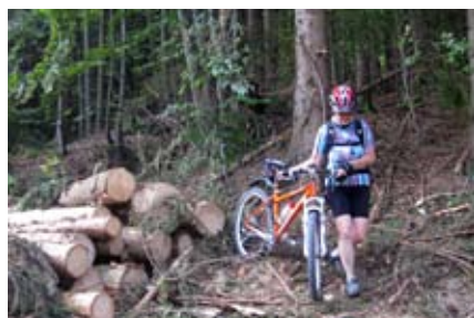
Hindernisse auf dem Weg