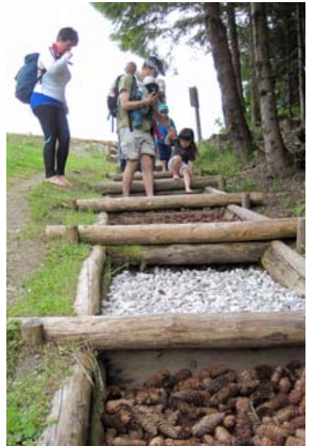
Hindernisse auf dem Weg

zem Splitt, Tannenzapfen und Flusskiesel. An der letzten Station erfrischten wir uns mit einem kühlen Fußbad. Anschließend kehrten wir noch in Sankt Anton zur Jause ein. Die Wirtsleute hier waren trotz der wilden Kinderhorde erstaunlich entspannt und verteilten Gummibären an die Kleinen. Beim Abstieg hatte uns das Wetterglück aber doch noch verlassen und ein satter Regenguss begleitete uns bis zum Parkplatz und nach Hause. Das tat