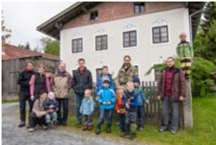
Vor unserem Bauernhof

A M NÄCHSTEN Morgen machten wir uns auf, den Bayerischen Wald zu erkunden. Über den gewohnten dichten Wald der unteren Hänge ging es hinein in eine seltsame Zahnstocherlandchaft. Als hätte ein Waldbrand gewütet – nur dass die toten Bäume nicht verkohlt sind, sondern als helle, rindenlose Gerippe kläglich in den Himmel starren. Die Arbeit von Ips typographus, dem Borkenkäfer, der seine fächerförmigen Gänge ausschließlich in die Rinde von Fichten gräbt. Plötzlich erhob sich aus dem Nebel ein steiler, schnurgerader Pfad nach oben ins dunstige Nichts. Die Himmelsleiter. Sie führt genau auf die Spitze des Lusen, 1373 Meter hoch und einer von drei Bergen im Bayerischen Wald. Sein Gipfel ist ein Haufen Granitblöcke, von annähernd gleicher Größe, die aussehen, als