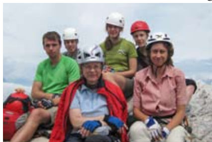
Gipfel des Amicizia Kletterstigs

A M FREITAG schließlich gab es verschiedene Möglichkeiten. Eine Gruppe ging klettern, zwei unternahmen eine Fahrradtour nach Riva und die dritte Gruppe suchte sich einen schönen und langen Klettersteig aus. Für den Via dell' Amicizia-Klettersteig