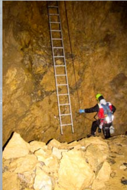
Und wieder hoch