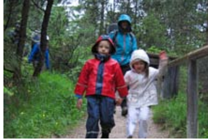
Zurück im Regen