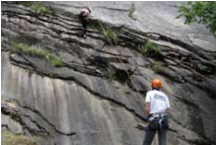
Klettern in Baone

A M VORLETZTEN Tag zog es dann die meisten zum Klettern. Der Rest der Truppe war mit dem Mountainbike Richtung Gardasee und Umgebung unterwegs. Im Baone-Klettergebiet, in dem es vor allem Mehrseillängentouren gab, beschäftigten sich die Kleinen mit dem Ab-