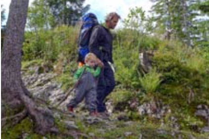
Die letzten Meter zur Hütte

schlag. Leider haben wir bis hier schon recht viel Zeit gebraucht und konnten so nicht mehr die Gratwanderung über die Halserspitze zur Gufferrhütte (1465m) nehmen, sondern sind über einen schmalen Weg zur Schönleitenalm (1480m) und weiter über Wirtschaftswege zu unserem Ziel gewandert.