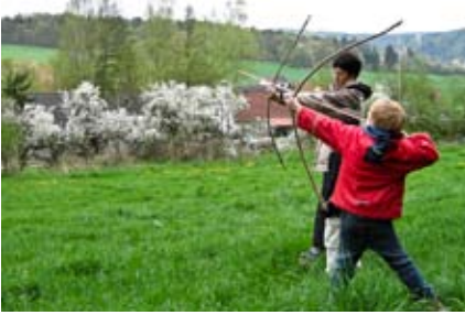
Die Bögen funktionieren